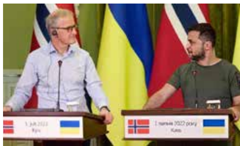
Le Premier ministre norvégien Gahr Støre annonce la signature d'un contrat « crucial » avec Bergen Engines pour l'Ukraine.

norvégien s'est encore améliorée en 2024, s'appuyant sur une année 2023 très solide. Les filiales au Bangladesh, en Espagne, en Italie, au Danemark, au Royaume-Uni, aux États-Unis et au Mexique ont toutes contribué à ce qui a été une année record pour Bergen Engines.