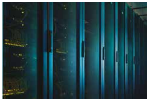
Piller est revenu dans le secteur des centres de données hyperscale avec son onduleur à batterie série M+ au Data Centre World de Francfort en mai.

Piller Inc aux États-Unis a bénéficié des travaux du gouvernement et des projets dans les secteurs