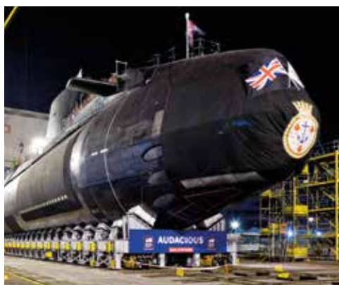
Les chariots de transfert ont contribué à un record en 2024 pour Clarke Chapman.

Clarke Chapman Ltd , basée dans le nord-est de l'Angleterre, a connu une très bonne année, sa meilleure depuis que le groupe a acquis l'entreprise auprès de Rolls-Royce en 2000. La société est principalement engagée dans des contrats de maintenance de long terme pour le réseau ferroviaire britannique et dans des projets pour les secteurs nucléaire et de la défense britanniques.