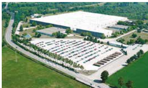
位于意大利北部阿尔齐尼亚诺的Marelli Motori工厂。

在2022年期间,Marelli与Bergen发动机公司密切合作,将其发电机与Bergen系列发动机的功率输出进行最佳匹配。在我们拥有之前,这两家公司经常将他们的产品组合成发电机组,并且都以其优质的质量和可靠性得到广泛认可。