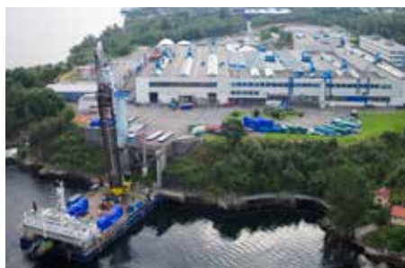
图片：Bergen发动机公司在挪威的工厂

年内，业务进行了轻微重组，并对运营、流程和程序进行了广泛的审查。我很高兴地报告，Bergen发动机公司在兰利管理下的第一年运营取得了成功，在经历了几年的亏损之后，终于恢复了盈利。这一转变的很大一部分归功于成本节约，而这些好处要到2023年才能完全实现。