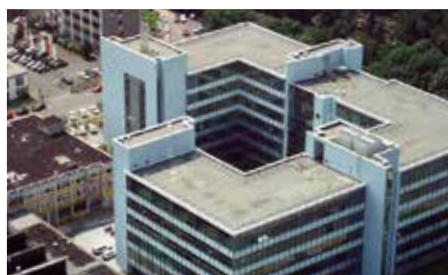
图片 Senefelderhaus, 前曼罗兰股份公司总部大楼被重新开发并出租给德国联邦警察。

2022 saw the first year of full occupancy of Senefelderhaus, the former headquarters building of 2022年，曼罗兰股份公司前总部大楼Senefelderhaus迎来了第一年的全面入住，该大楼于2012年与印刷机业务一起被收购。2017年至2022年间，六层高的Senefelderhaus被重新开发，并与当时收购的其他剩余建筑一层一层出租给德国联邦警察局。如今，Senefelderhaus是联邦警察主要的培训学院，容纳2000多名学生和教师。